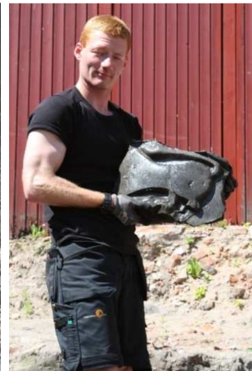
En glad arkæolog