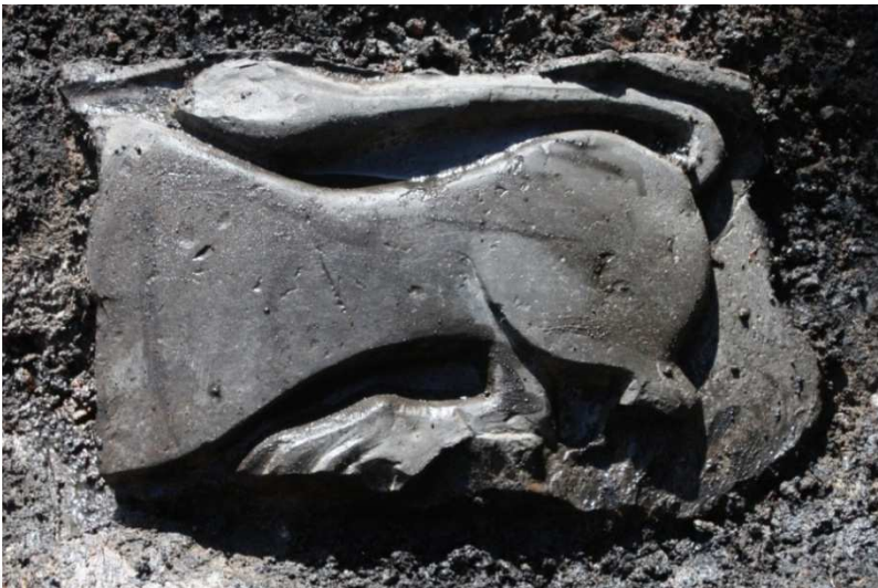
Døbefontsfragmentet i brandlaget fra 1272.

På det fundne stykke ses bagkroppen af en løve. Det fine stenhuggerarbejde lå i et brandlag, som vi tolker som et resultat af byens brand i 1272. Selve døbefonten kan være noget ældre og stammer måske fra 1100-årene. Det er sandsynligt, at den har stået i domkirken og altså er en forgænger for den nuværende støbte bronzefont.