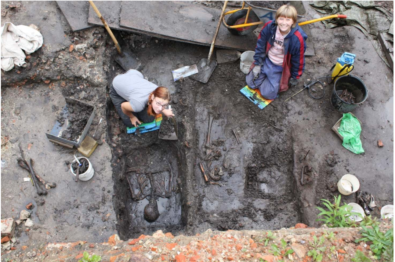
Fra udgravningen i 2008