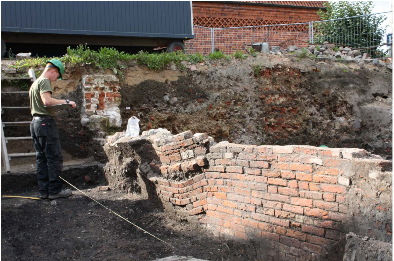
Fra udgravningen i 2008