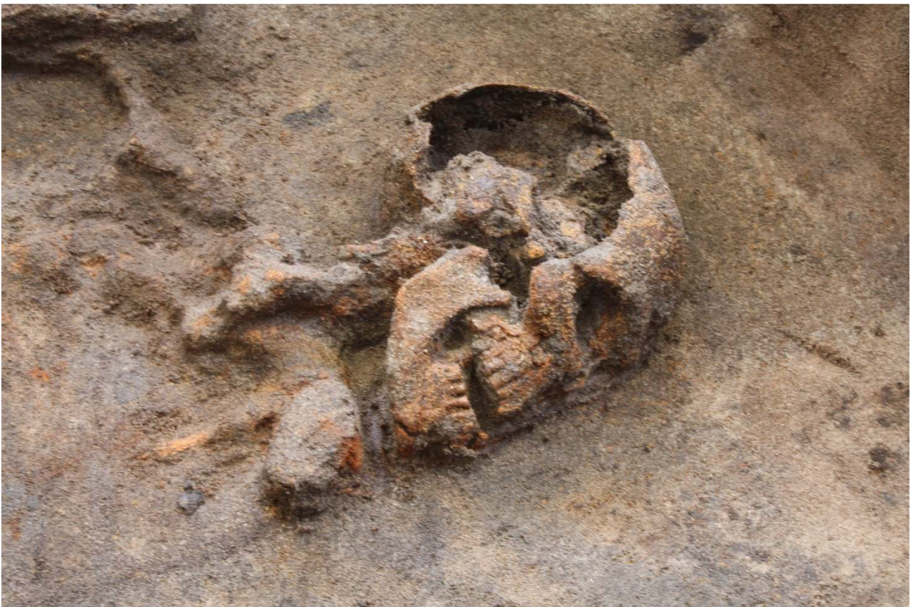
Fra udgravningen i 2008. Mand, ca. 40 år, kulstof 14-dateret til 800-årene. En af Danmarks første kristne?

Selve udgravningen vil forløbe i perioden 2010-12. Nyheder og foreløbige resultater vil kunne følges på bloggen http://lindegaarden.wordpress.com